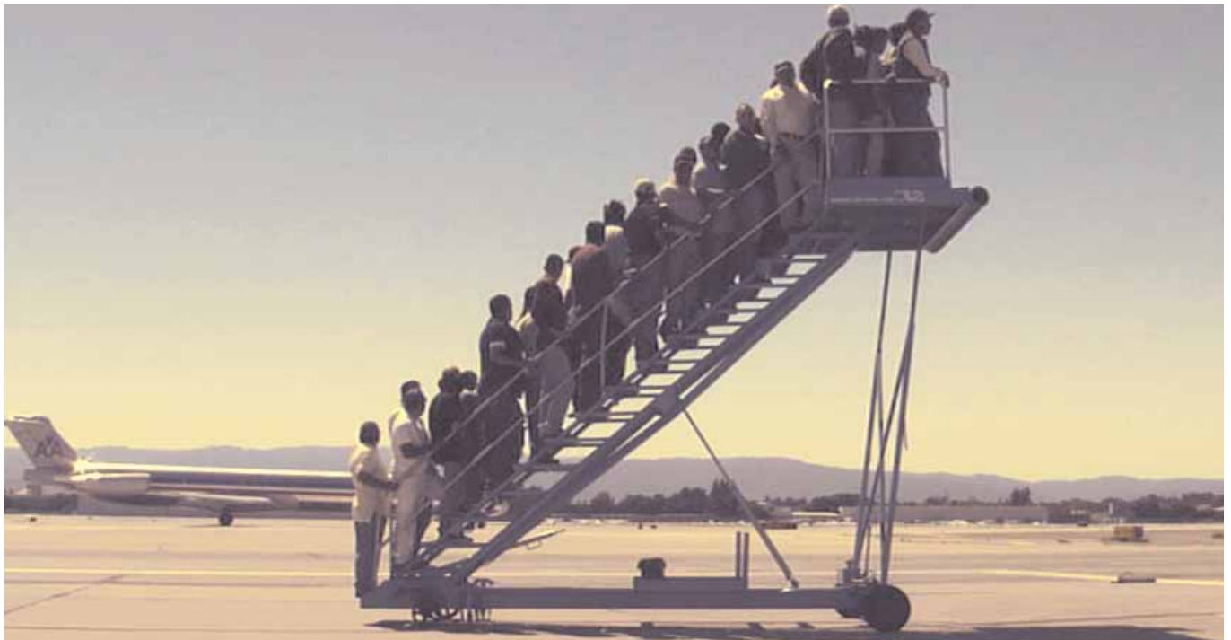
Vepra e Pacit është në ekspozim deri në janar në Smith-Stewart Gallery në New York

jetueme, një imazh që sheh diku, një paragraf libri apo një objekt që të del para syve mund të bahen shkas për lindjen e një pune të re. Nga ana tjetër çdo vepër e mbarueme thërret në skenë veprën e re. Asht si një lloj kalim stafete nga njena tek tjetra ku asnjena nuk e thotë fjalën e fundit por bashkë krijojnë universin nëpër të cilin ka kaluar autori i tyre.