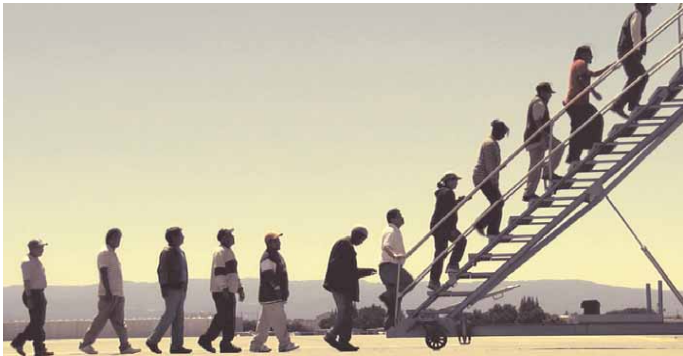
Këtu dhe djathtas dy sekuenca nga "CPT - Centro di Permanenza Temporanea" ku të huajat në një aeroport ngjisin shkallët e një avioni që s'do t'i marrë kurrë