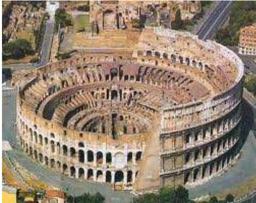
(Colosseo di Roma)

Roma (IPA: ['roma]) è un comune italiano di 2.777.979 abitanti, capoluogo della provincia di Roma, della Regione Lazio e capitale della Repubblica Italiana.