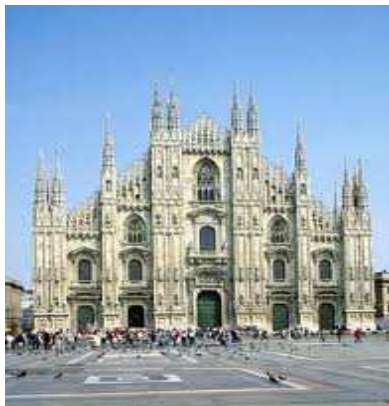
(Duomo di Milano)

Milano è un comune di circa 1.338.436 abitanti, capoluogo della Regione Lombardia. Per popolazione, è il secondo comune dopo Roma, costituendo così il centro dell'area metropolitana più popolata d'Italia e una delle più popolate d'Europa. Fu fondata dagli Insubri, all'inizio VI secolo. Nel 222 a.c. fu conquistata dai Romani e fu chiamata Mediolanum.