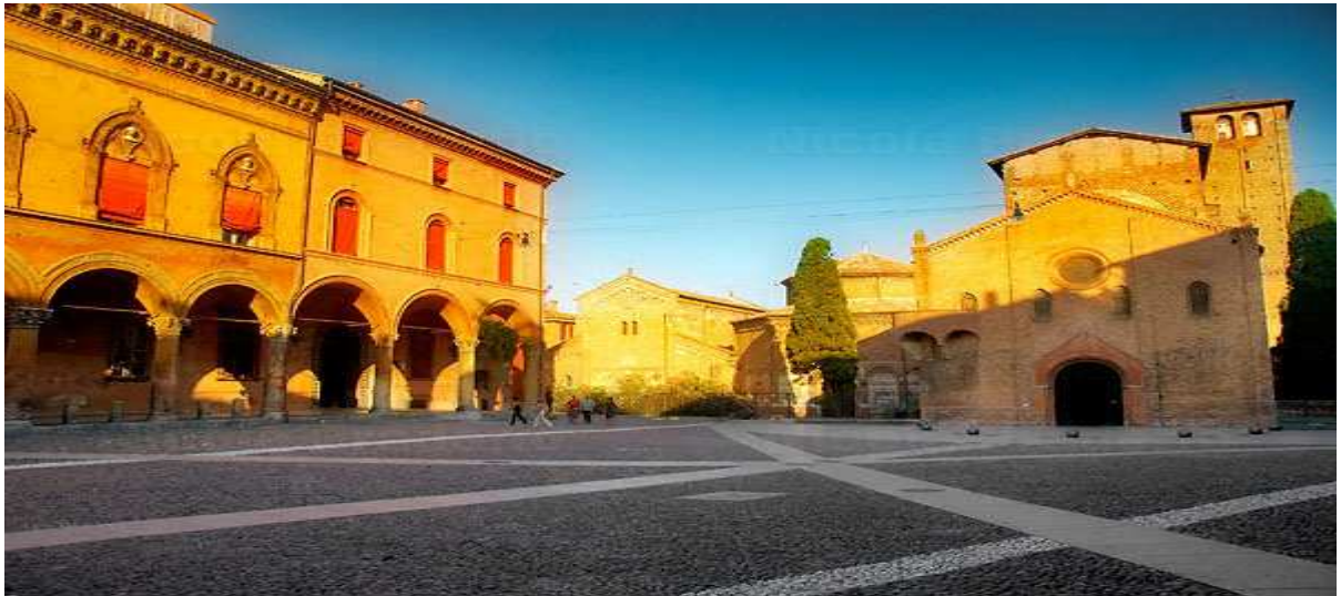
(Piazza Santo Stefano)